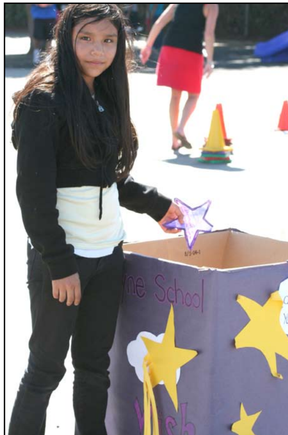
Payne student places her “star of goals” into the school’s box of dreams.