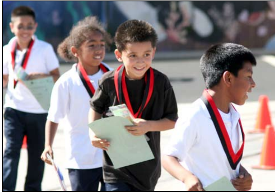
Students proudly rush to participate in the walk-of-fame school parade held in honor of their achievements on the California state test.

Payne and fellow Inglewood Unified School District school, Highland Elementary received an “Academic Achievement Award” last semester from the state of California for surpassing 800 on the Academic Performance Index.